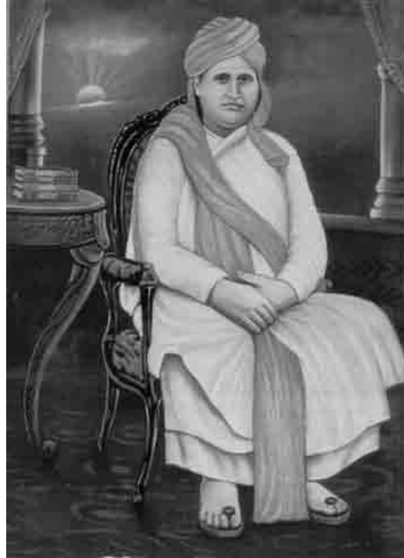
Swami Dajanand Saraswati Reformator der Wedischen Hindu-)Religion

Kommissions-Verlag Markert & Peters. Leipzig, Sceburgstr. 53