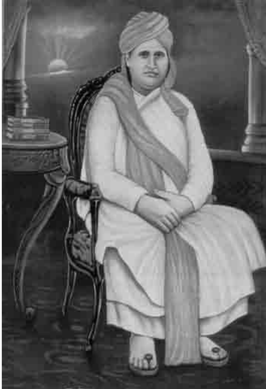
Swami Dajanand Saraswati